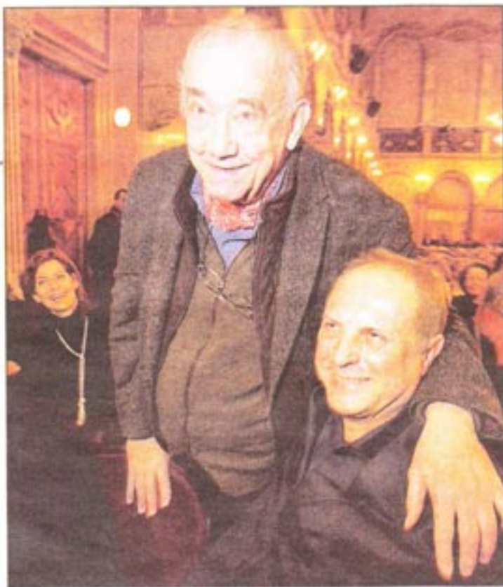
Die Künstler Daniel Spoerri & Attersee

Nach dem Augenschmaus wurde Delikates für den Gaumen serviert: Alpenlachs, geschmorte Schweinsbackerl mit zweierlei Püree und flüssiger Schokoladekuchen.